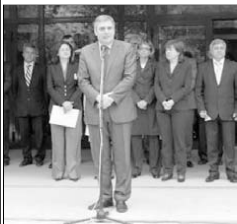
Вицепремиерът Ивайло Калфин открива XI изложение за земеделска и автомобилна техника, чийто традиционен домакин е РУ